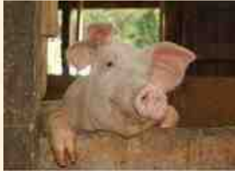
- Хрю I